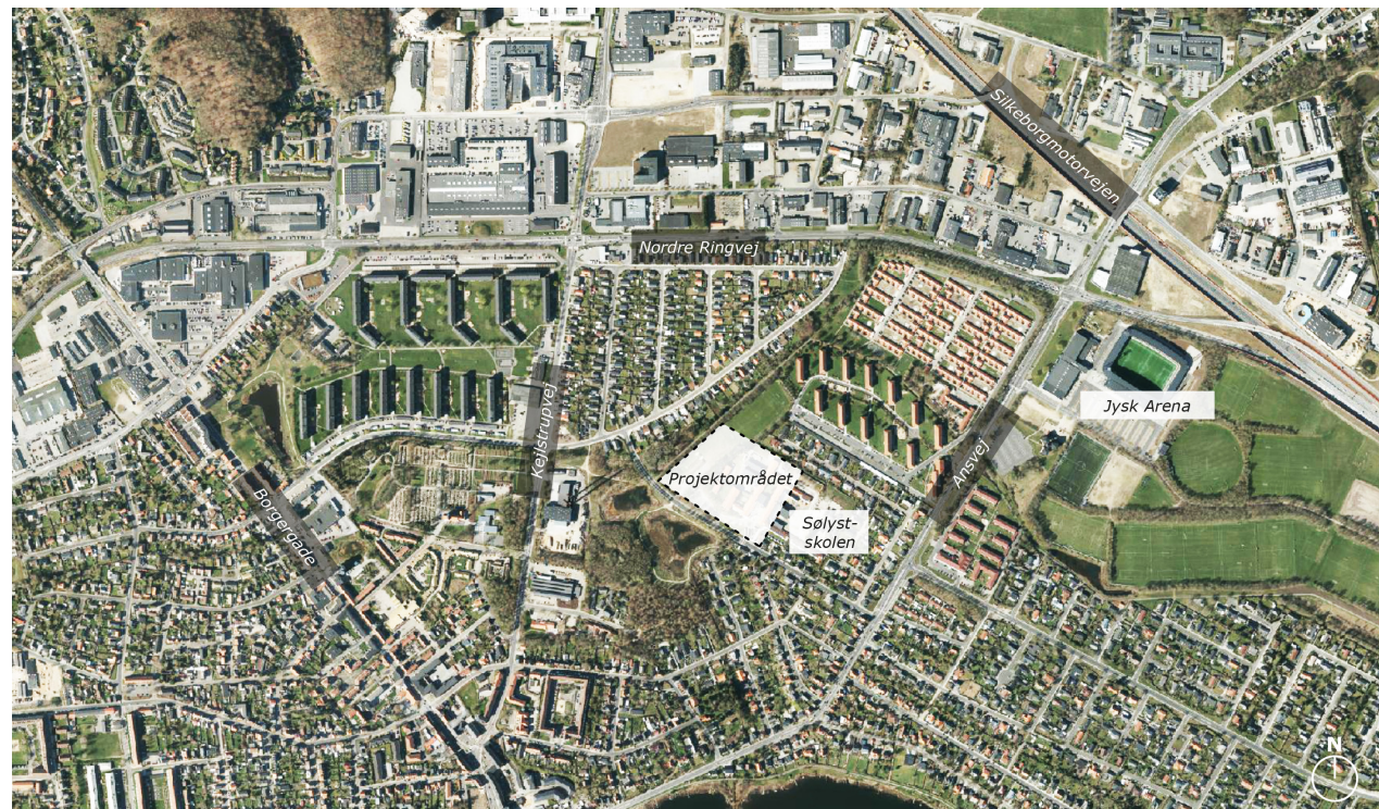
Projektområdets placering i Silkeborg

“ Områdestudiet skal sikre sammenhæng i bygningerne, udearealerne og infrastrukturen. Planen identificerer en række finansierede og u-finansierede delprojekter til politisk prioritering.