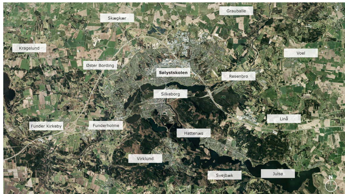
Sølystskolens placering i Silkeborg Kommune

Områdestudiet består af tre dele. Først en beskrivelse af projektets baggrund og formål. Herefter følger en kortlægning af området i dag, hvorefter selve områdestudiet – altså den fælles vision – præsenteres sammen med de indsatser, der peger på. Til sidst præsenteres du for en række bindinger til hver af de beskrevne indsatser.